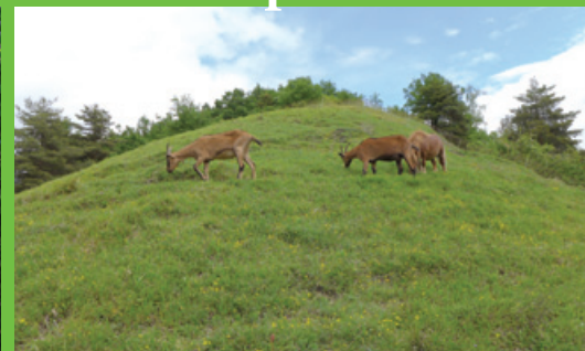
coteau préservé grâce au pâturage