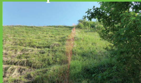
travaux de débroussaillage et pose de clôtures